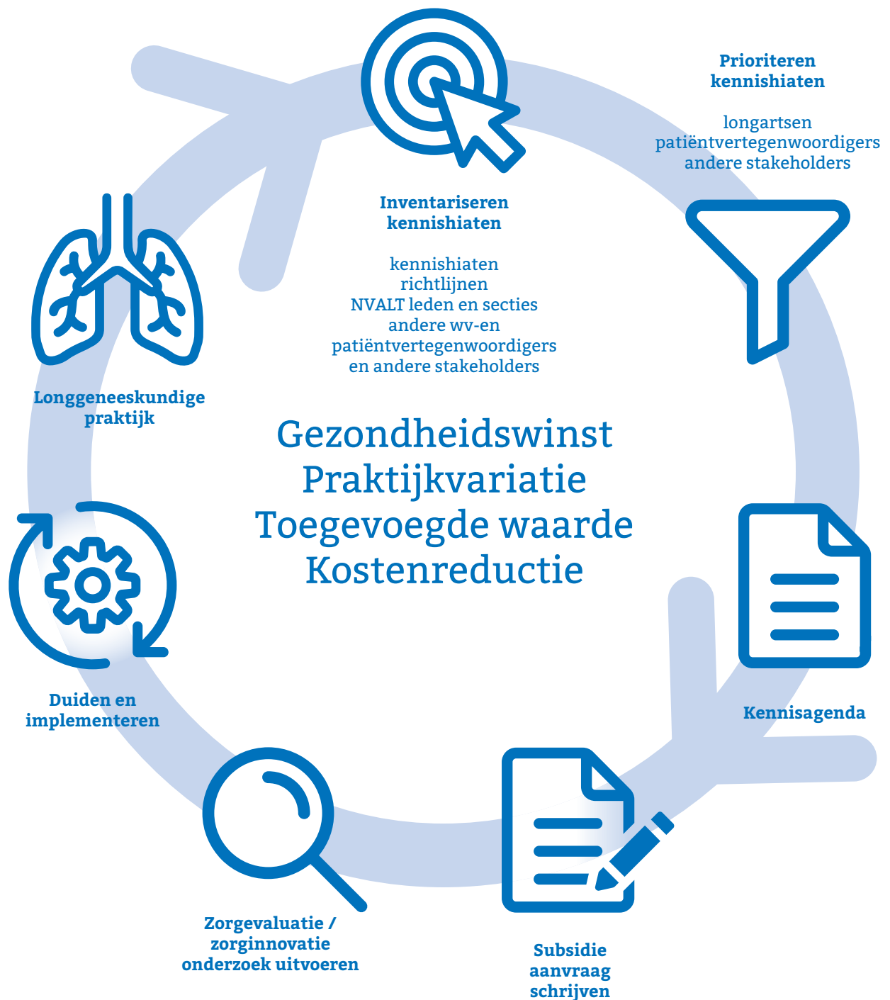
Figuur 1: Proces van zorgevaluatie voor de longeneeskundige praktijk